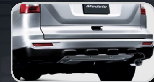
Ốp trang trí sau

*Chế độ bảo hành phụ kiện chính hãng: 1 năm/20.000km tùy theo điều kiện nào đến trước.