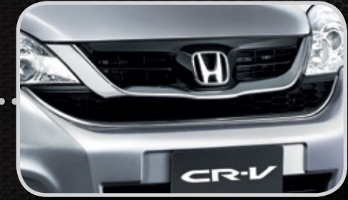
Lưới tản nhiệt

Bộ phụ kiện chính hãng với những thiết kế tinh tế không chỉ mang đến một diện mạo sang trọng, cá tính, mà còn tăng cường các tính năng và khả năng vận hành cho xe.