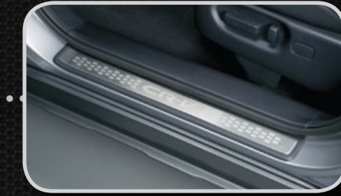
Nẹp bước chân