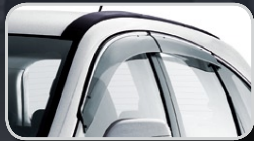
Vành che mưa