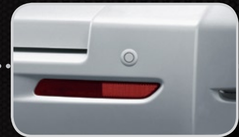
Cảm biến lùi