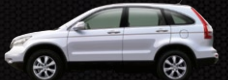
NH-700M - Ghi bạc thời trang ●