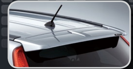
Cánh lướt gió đuôi xe