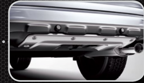
Ốp trang trí sau