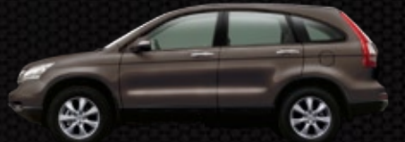
YR-578M - Titan mạnh mẽ ○