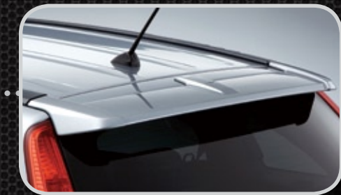
Cánh lướt gió