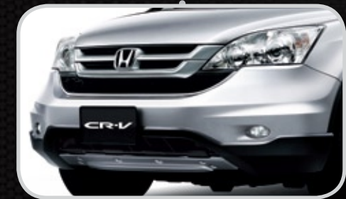
Ốp trang trí trước