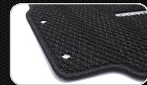
Thảm trải sàn

*Chế độ bảo hành phụ kiện chính hãng: 1 năm/20.000km tùy theo điều kiện nào đến trước.