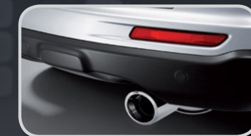
Chụp ống xả

*Chế độ bảo hành phụ kiện chính hãng: 1 năm/20.000km tùy theo điều kiện nào đến trước.