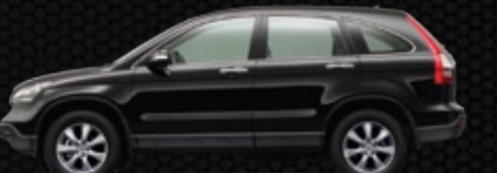
NH-731P - Đen ánh độc tôn ○