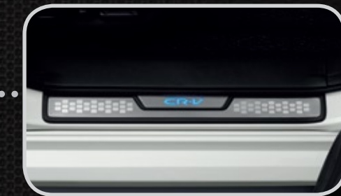
Nẹp bước chân có đèn trang trí