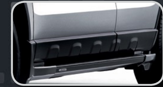
Bậc lên xuống