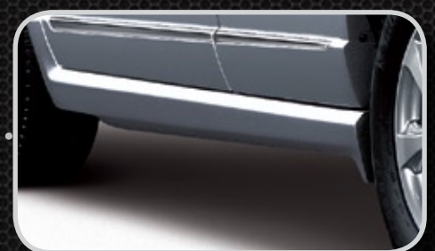
Ốp trang trí bên