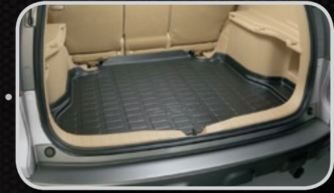
Khay hành lý