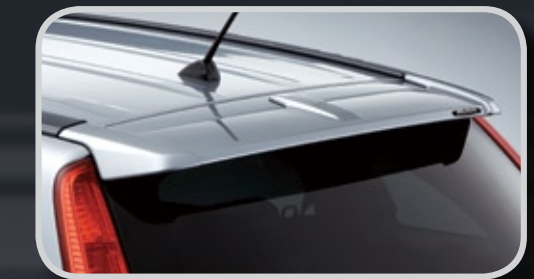
Cánh lướt gió đuôi xe