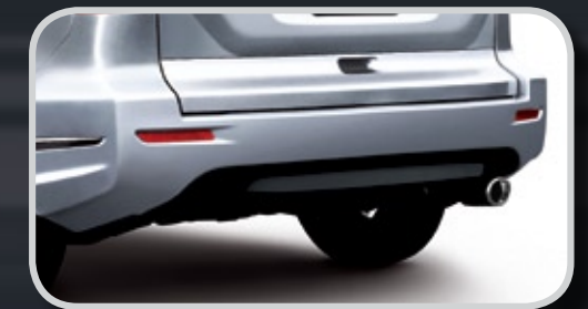
Ốp cản sau