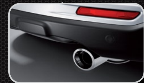
Chụp ống xả