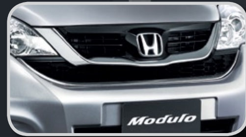
Lưới tản nhiệt