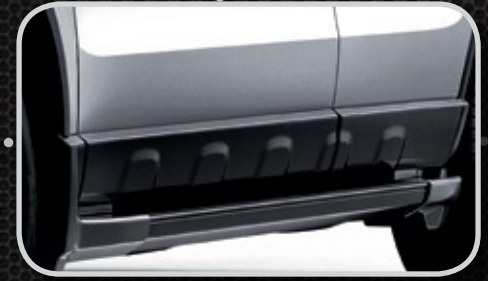
Bạc lên xuống