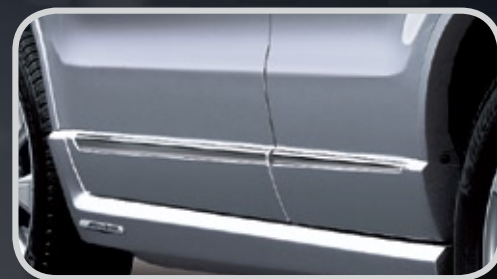
Ốp trang trí cửa