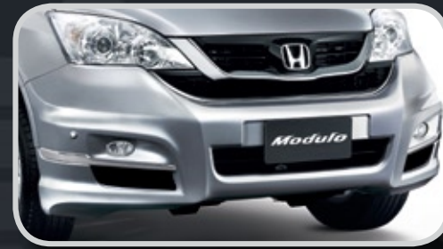
Ốp cản trước

Bộ phụ kiện Modulo Đẳng Cấp chính hãng với tiêu chuẩn quốc tế mang đến cho chiếc xe của bạn một dáng vẻ độc đáo, duy nhất và hoàn toàn khác biệt. Hình ảnh chiếc xe của bạn sẽ mang một phong cách khoáng đạt và mạnh mẽ hơn. Không chỉ vậy, bộ Modulo Đẳng Cấp còn kết hợp hoàn hảo với chiếc xe CR-V để tối ưu hóa khả năng vận hành. Bộ Modulo Đẳng Cấp đưa chiếc xe CR-V của bạn lên một vị thế đáng ao ước của nhiều người.