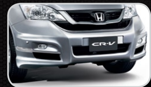
Ốp cản trước