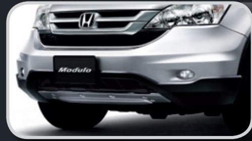
Ốp trang trí trước

Phụ kiện Modulo Thể Thao chính hãng với tiêu chuẩn quốc tế khoác lên chiếc xe một dáng vẻ khỏe khoắn và mạnh mẽ, mang đậm phong cách thể thao. Những thiết kế đầy cá tính mang đến chất lượng hàng đầu và khả năng vận hành cao cấp hơn, lôi cuốn người yêu xe.