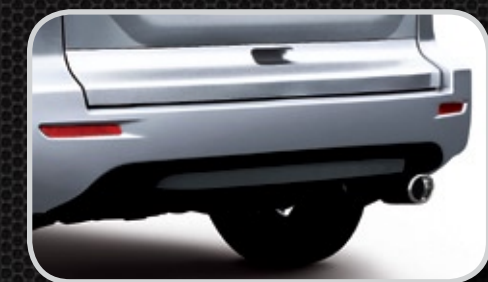
Ốp cản sau