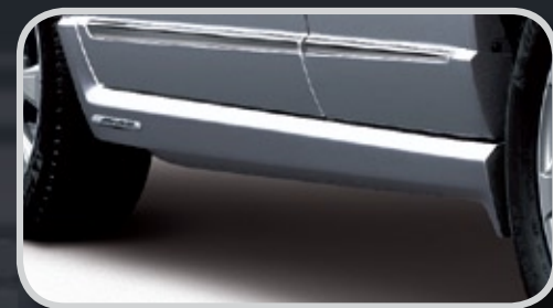
Ốp trang trí bên