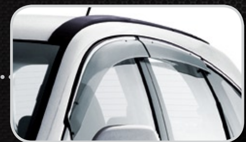
Vè n che mưa