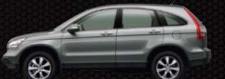
NH-737M - Ghi xám cá tính ○