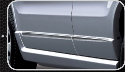
Ốp trang trí cửa